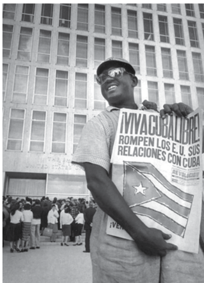
(Roberto Salas. "Primeiro dia", 1961. In: Cien imágenes de la Revolución Cubana , 1996.)

A foto, de janeiro de 1961, destaca o rompimento das relações diplomáticas entre Estados Unidos e Cuba.